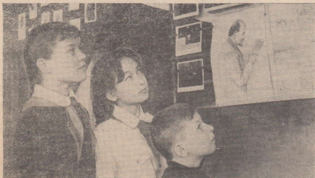
В ДОМЕ ПИОНЕРОВ.

Центральный Комитет Коммунистической партии Советского Союза.